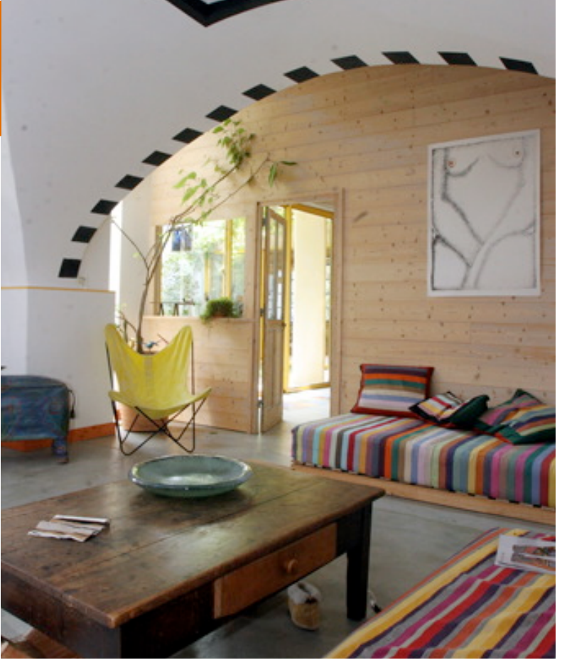
Premier niveau enterré au nord, façade principale exposée au sud : la transformation réfléchi d'une ruine en maison bioclimatique.