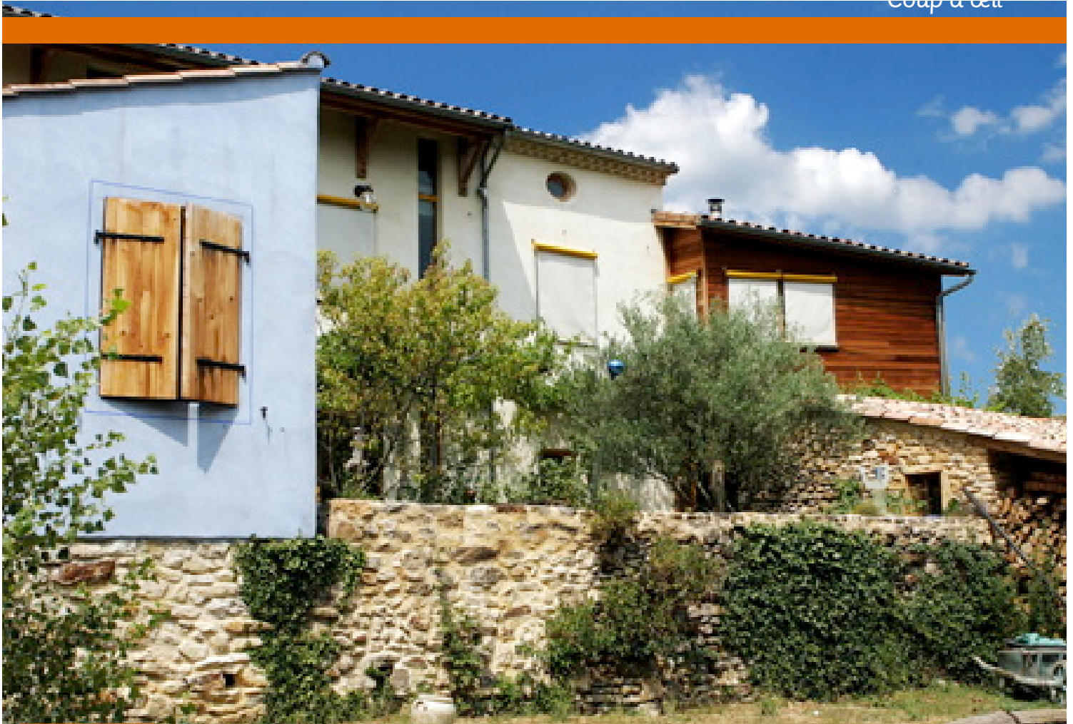
Pierre, bois, monomur... un patchwork réussi de matériaux naturels.